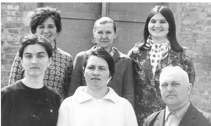
Коллектив восьмилетней школы, 1971 год.