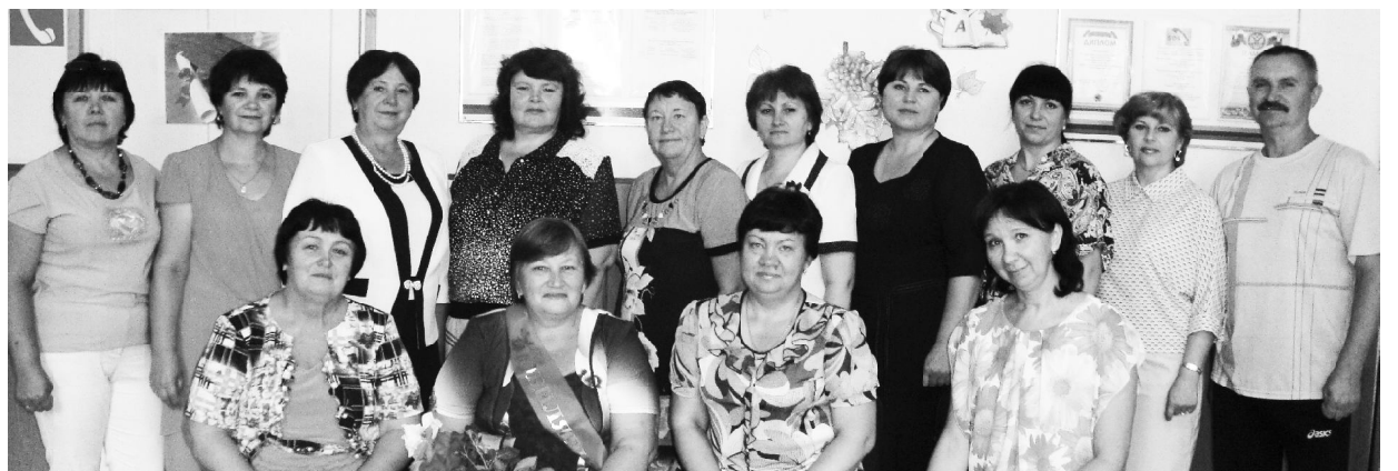
Педагогический состав Леоновской СОШ.

В 1989 году, по ходатайству родителей учащихся, Леоновская школа получила статус средней общеобразовательной школы.