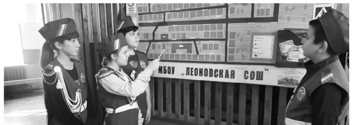
Отряд ЮИД «Жлаксон», победитель многих конкурсов, включая всероссийские.