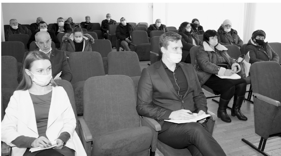
■ В зале: работники ветеринарной службы и сборщики молока.

? - Во время встречи вы говорили о проведении масттеста, что это такое и как часто он проводится?