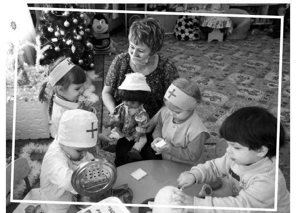
■ В одной из групп идет «прием пациентов».

Воспитанники детского сада «Ивушка» стали участниками недели здоровья под девизом «Здоровыми быть здорово!». Мероприятия были направлены на формирование здорового образа жизни: утренняя гимнастика, гимнастика пробуждения, дорожка здоровья, хождение по массажным коврикам, закаливающие процедуры, тематические беседы, а также мастер-класс для детей по изготовлению нестандартного спортивного оборудования «Моталочки», дистанционная Международная викторина «Время знаний». Увлекательные соревнования «Снежные забавы» с играми и эстафетами на свежем воздухе со сказочными героями вызвали восторг и оставили много впечатлений у ребят. А выставка рисунков и фотографий «Зимние каникулы» рассказала о семейном досуге на свежем воздухе.