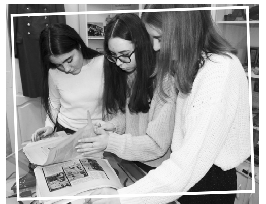
■ Школьники знакомятся с экспонатами.

Ученики 11Б класса МБОУ Обливская СОШ № 1 побывали на экскурсии в школьном краеведческом музее «Исток», расположенном в здании бывшей вечерней школы. Одинадцатиклассники с интересом познакомились с музейными экспонатами, которые распределены по разделам: «Великая Отечественная война»; «Культура казачества»; «Союз Советских Социалистических Республик»; «Школьные годы чудесные».