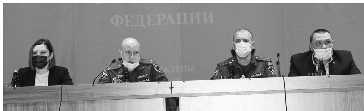
■ Президиум семинара.

Необходимость проведения семинара в условиях сохранения напряженной пожароопасной ситуации направлена на повышение уровня знаний специалистов в сельской местности, от грамотных действий которых при возникновении чрезвычайной ситуации зависит не только сохранение имущества, но и здоровье людей.