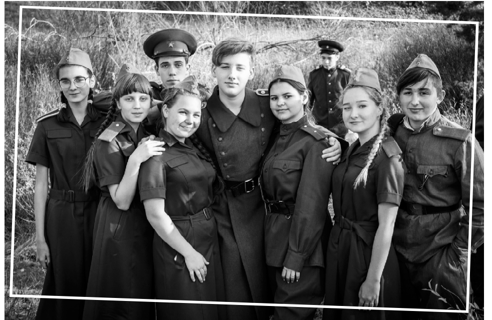
■ Школьники во время съёмок видеоклипа.