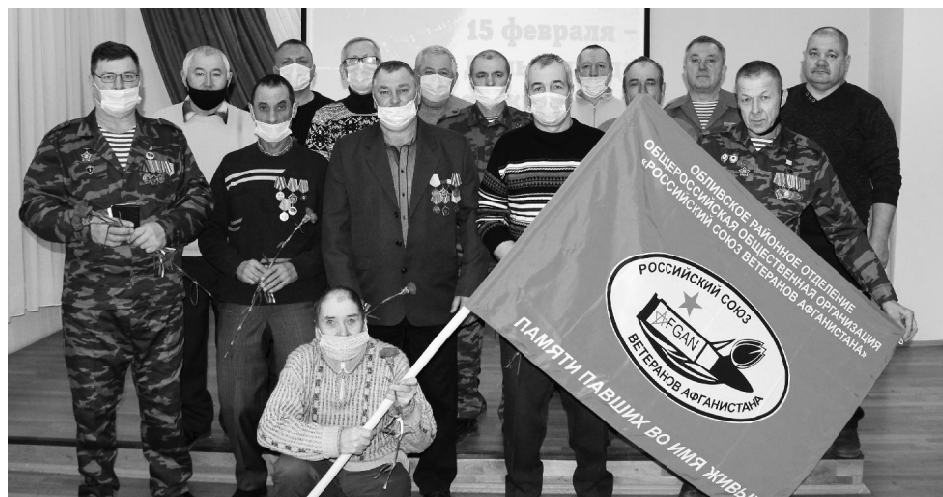
■ Ветераны Афганистана в Обливском РДК.