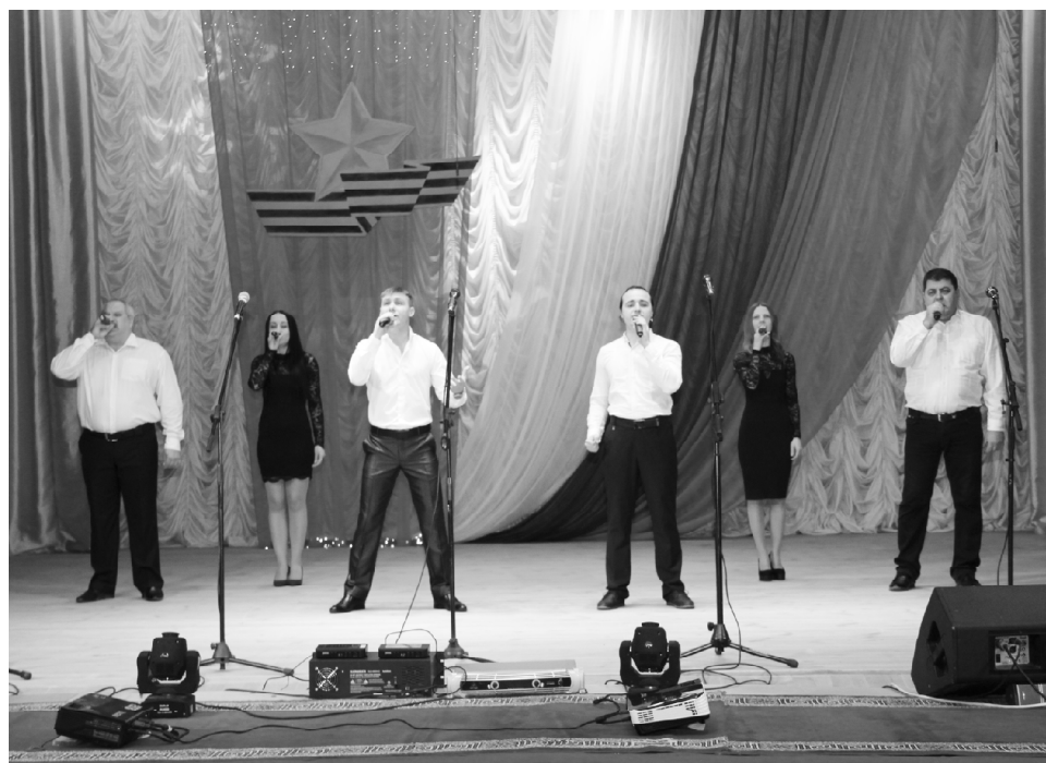
■ На сцене - народная вокальная группа «Вишневый сад».