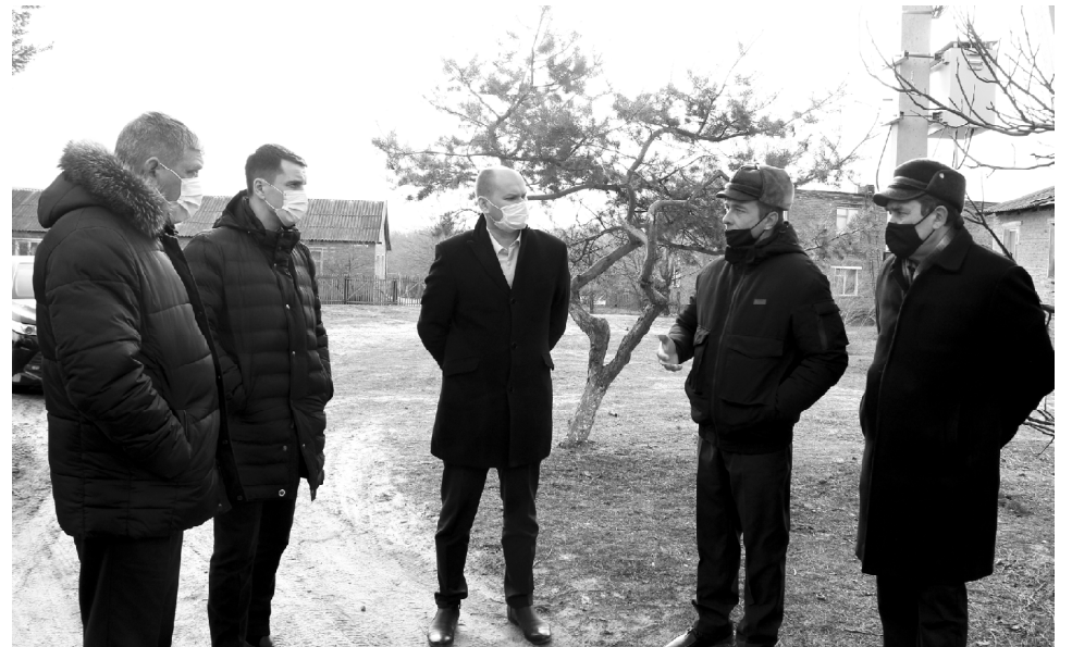
■ Участники поездки в поселке Сосновом у точки коллективного доступа к интернету.

Кроме того, во время поездки заместитель губернатора и министр цифрового развития и связи побывали