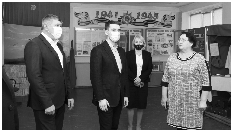
■ В Обливской СОШ №2 А.А. Хохлова ознакомили с экспозицией школьного музея.

в трех отделениях почты России: ОПС № 347141 в ст. Обливской, ОПС в х. Караичеве, ОПС в пос. Сосновом. Затем в администрации Обливского района А.А. Хохлов провел с представителями администрации района, министерства