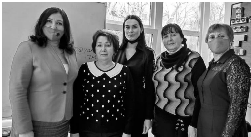
■ Представители «Лучика» с организаторами конкурса.

Конкурс проходил в конце марта в г. Ростове-на-Дону. Десять образовательных организаций Миллеровской зоны предоставили на суд жюри свои видеоролики, в которых отражена вся работа ДОУ. Обязательным условием было участие команды ЮПИД. Также необходимо было отразить предстоящий 85-летний юбилей ГАИ ГИБДД и 20-летие газеты «Добрая дорога детства», которая рассказывает подрастающе-