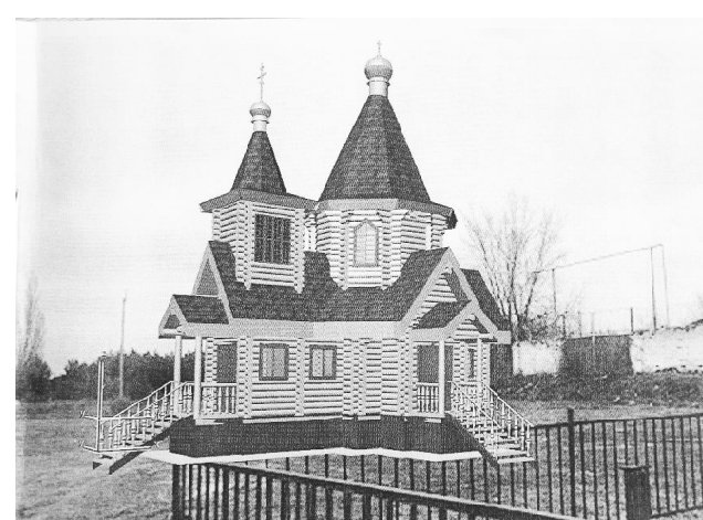
■ Таким будет новый храм (эскиз).