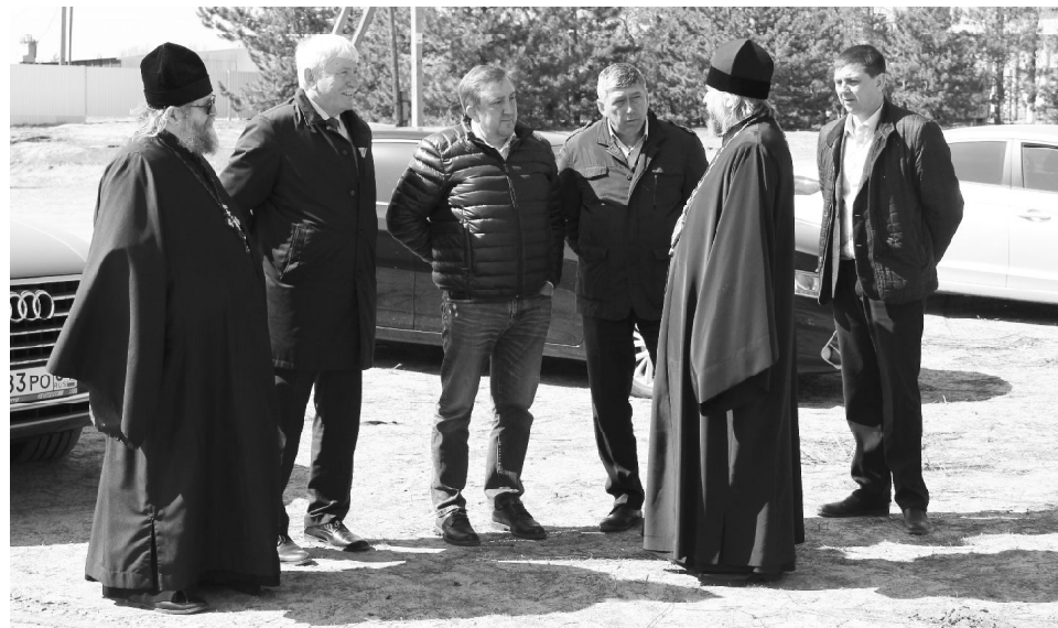
■ Участники встречи на месте будущего строительства храма.