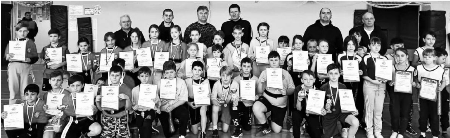
■ Участники муниципального этапа первенства области с наградами.

В начале ноября прошлого года Ростовская федерация регби запустила новый проект – программу «Развитие детского регби в муниципальных районах Ростовской области». В рамках проекта в ноябре 2020 года в Ростове-на-Дону группа педагогов Обливского района приняла участие в семинаре по тэг-регби для учителей и тренеров. Сразу после пройденного курса обучения преподаватели приступили к занятиям с детьми по новому виду спорта. И вот, 17 марта, в спортивном зале МБУ ДО Обливская ДЮСШ состоялся муниципальный этап Первенства области – Кубок Ростсельмаша по тэг-регби среди обучающихся общеобразовательных учреждений Обливского района 2010-2011 года рождения. В соревнованиях приняли участие команды МБОУ Обливская