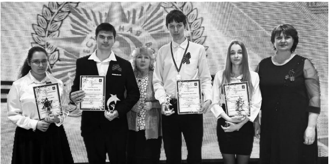
■ Делегация Обливского района с наградами.

Обливчане заняли сразу четыре призовых места. В номинации «Художественное слово «Строки, опаленные войной»» в возрастной категории от 14 до 20 лет выступили четыре участника из ст. Обливской.