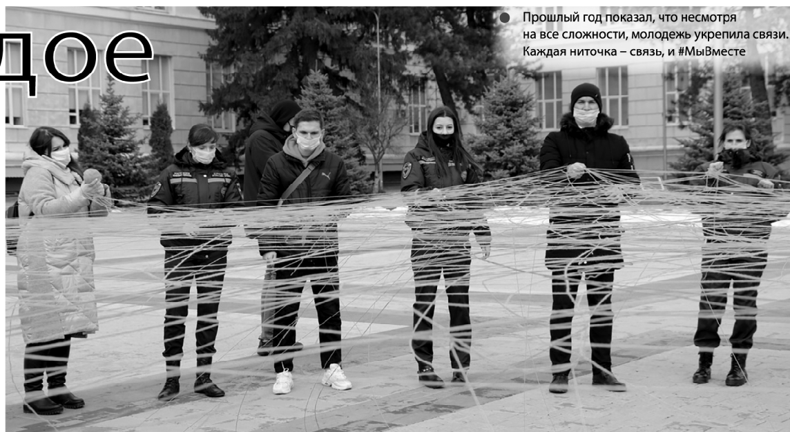
Прошлый год показал, что несмотря на все сложности, молодежь укрепила связи. Каждая ниточка – связь, и #МыВместе

С этого года комитет по молодежной политике также является ответственным за достижение результатов нового