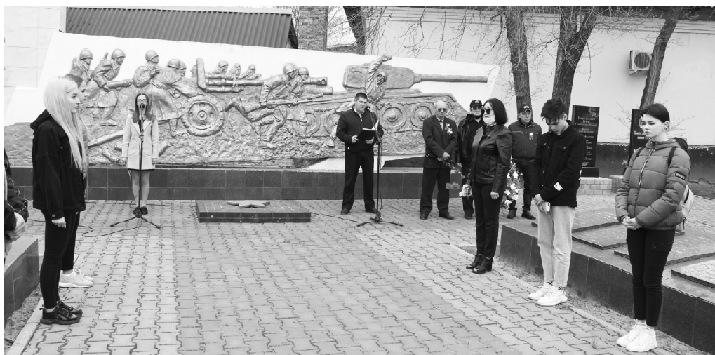
■ Во время митинга.