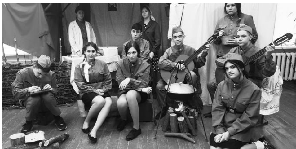
■ Коллектив «Родина» инсценировал песню «Темная ночь».

Творческие коллективы Обливской СОШ №1, Ковыленской ООШ, Обливской СОШ №2, Солонецкой СОШ, Каш-