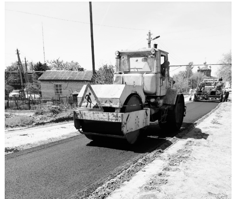
■ Работы идут на ул. Советской.

В ст. Обливской выполнен ремонт асфальтированной дороги на двух центральных улицах. Работы по восстановлению изношенных верхних слоев асфальтобетонного дорожного покрытия проведены на нескольких участках улиц Синькова и Советской. Денежные средства на выполнение ремонта выделены из районного дорожного фонда администрации Обливского района в рамках муниципальной программы «Развитие транспортной системы», сумма затрат составила 3,9 миллиона рублей. Работы по обновлению асфальта провел Обливский участок ГУП РО «Ростовавтодор».