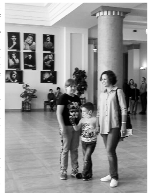
■ В театре им. Горького.

На традиционном интерактивном приеме, который прошел 31 мая, с просьбой организовать