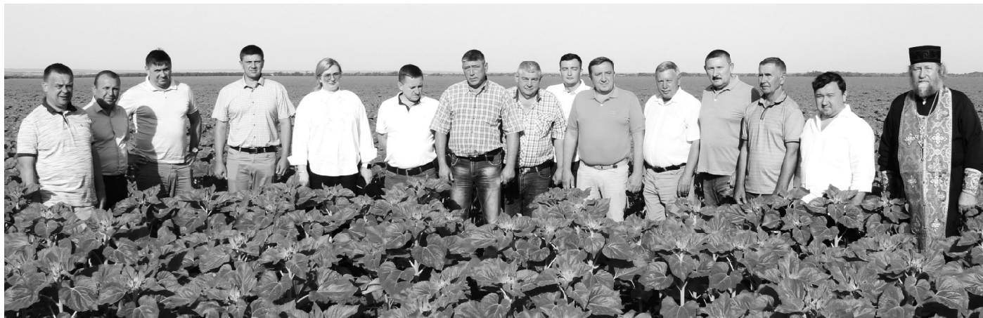
■ Участники смотра на поле подсолнечника ООО «Восход».