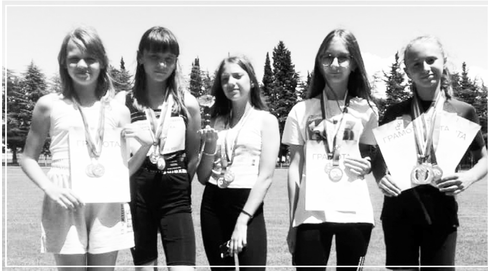
■ Команда, занявшая первое место на Всероссийских соревнованиях в июле.

С 25 сентября по 4 октября 2021 года в г.Сочи прошли Всероссийские соревнования по легкоатлетическому многоборью «Шиповка юных» среди обучающихся образовательных и спортивных организаций. В соревнованиях приняли активное участие 16 воспитанников МБУ ДО Советская ДЮСШ и завоевали призовые места.