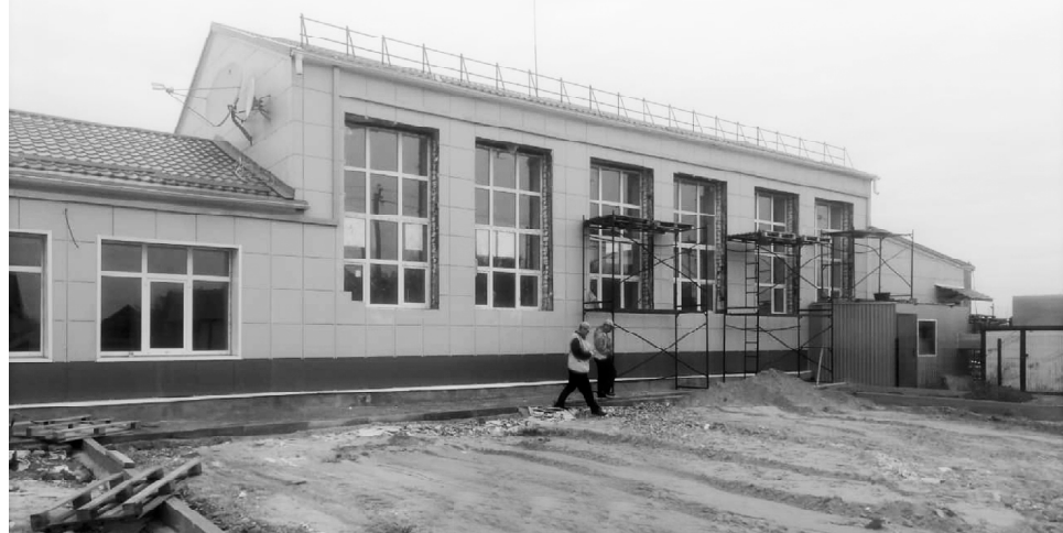
■ Ремонтные работы близятся к окончанию.

В рамках реализации проекта были проведены игры: "Резиночки", "Салки", "Жмурки", "Прятки", "Городки", "Классики", "Ручеек" и другие.