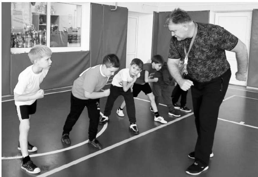
■ Идет урок физкультуры - делаем, как учитель.

ким покрытием и разметками, матами и турниками, с баскетбольными сетками и мячами, как у настоящих спортсменов. Главный, конечно, на уроке наш учитель, но каждый раз он готовит нам такой комплекс заданий, где каждый из нас чувствует себя Олим-