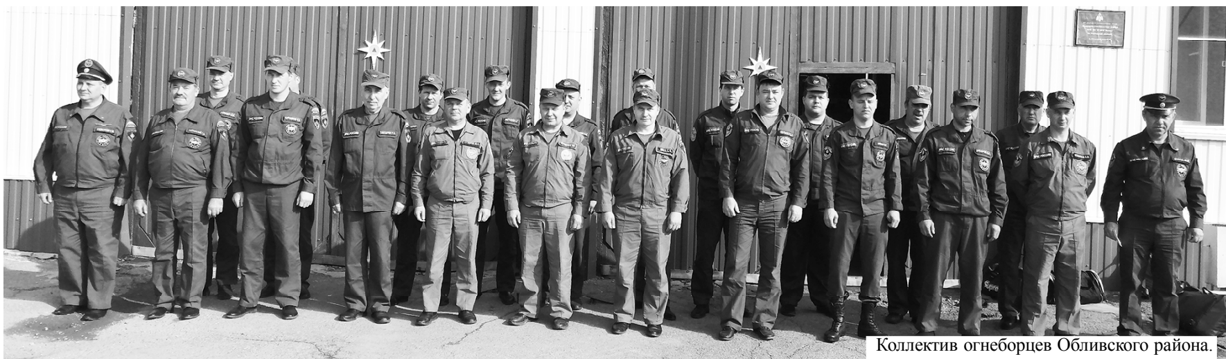
Коллектив огнеборцев Обливского района.

Председатель совета и коллектив ВДПО Обливского района.