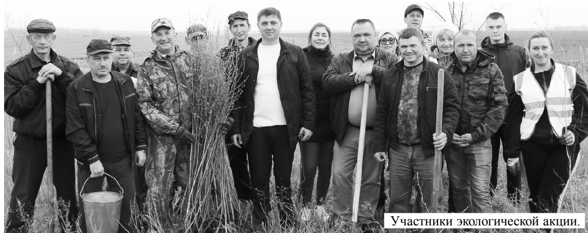
Участники экологической акции.

На въезде в Обливский район со стороны Волгоградской области вдоль автодороги высажены саженцы березы и рябины. Субботник по их высадке прошел 20 апреля, в нем приняли участие работники администраций района и Обливского сельского поселения, ВДПО, социальной сферы, образования, культуры. Саженцы