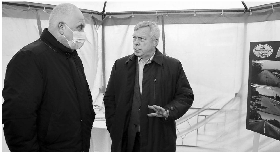
Дороги, жилье, ЖКХ – всегда во главе списка приоритетов правительства области