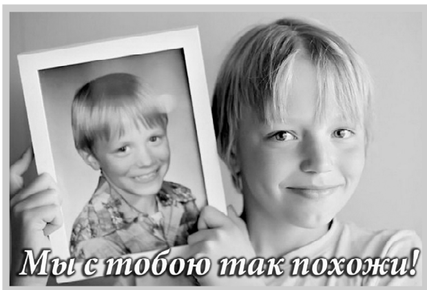
Мы с тобой так похожи!

Фотографии, набравшие наибольшее количество голосов, будут опубликованы в выпуске «Авангарда» от 20 мая 2022 года.