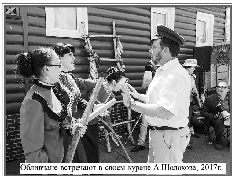
Обливчане встречают в своем курене А.Шолохова, 2017г.