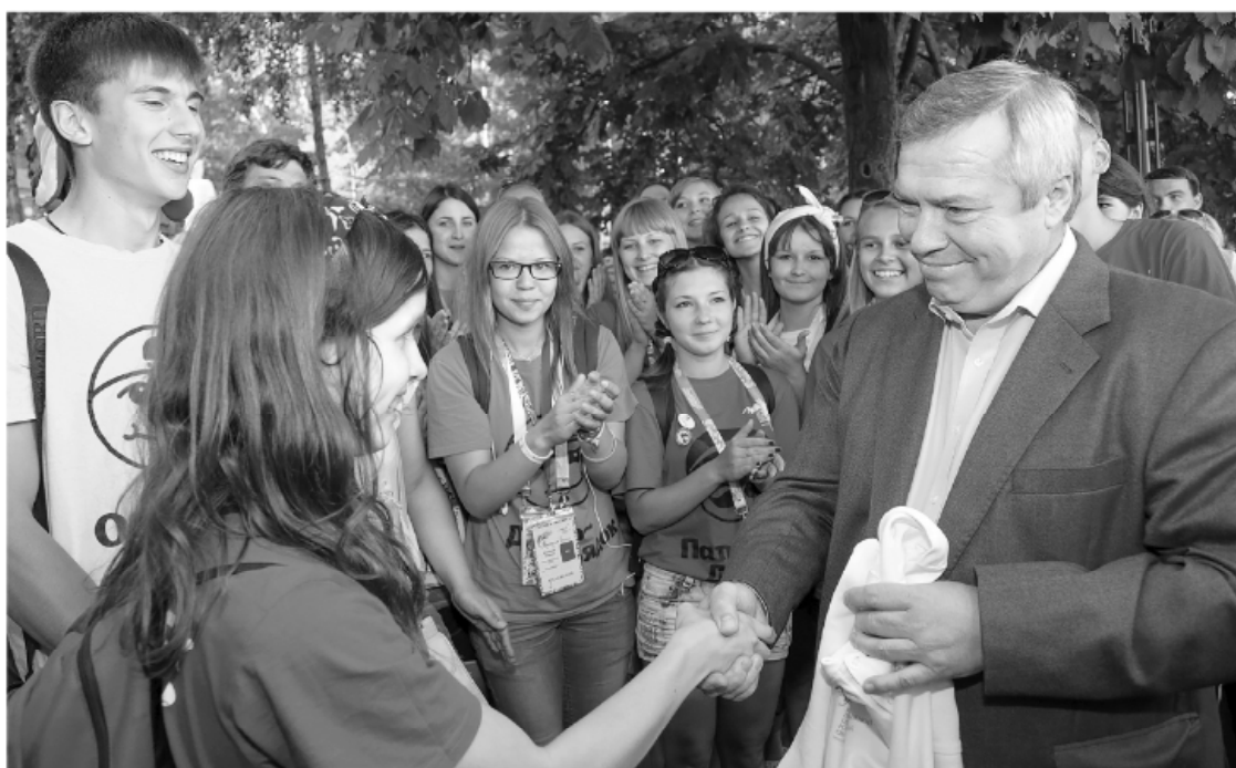
Лето-2022 позволит отдохнуть детям разных возрастов с учетом их интересов и особенностей

За счет бюджета в оздоровительные лагеря Неклиновского, Миллеровского, Семикаракорского, Тарасовского и других районов области уже закуплены путевки для детей, находящихся в трудной жизненной ситуации. Но поддержку получают все семьи – за самостоятельно приобретенную путевку родители смогут компенсировать до 100% ее стоимости. Эта мера под-