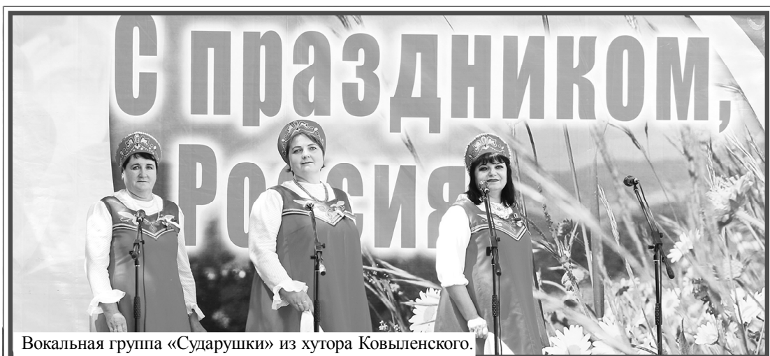
Вокальная группа «Сударушки» из хутора Ковыленского.