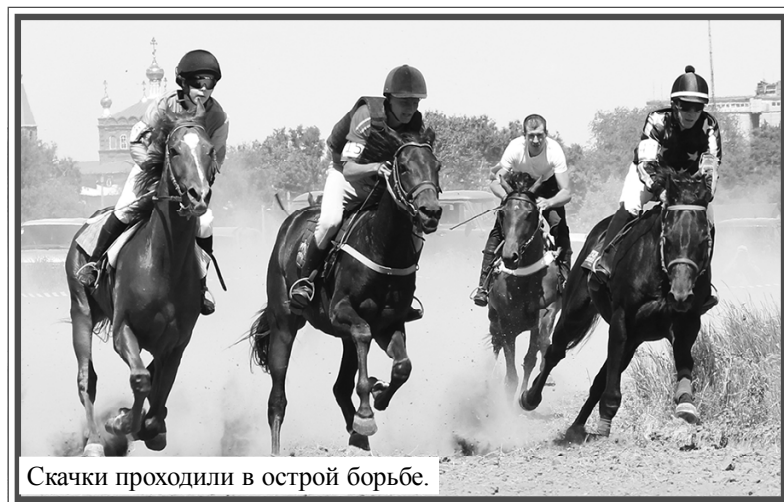
Скачки проходили в острой борьбе.

В День России, 12 июня, жители станицы Обливской и всего района были приглашены на народное гулянье, которое проходило на берегу Чира. Праздничная программа под названием «Обливская моя, мой Дон, моя Россия!» включала в себя районный фестиваль самодеятельного народного творчества «Ты тоже родился в России» и конно-спортивные соревнования на кубок атамана Обливского юрта. Для гостей праздника на месте его проведения была организована выездная торговля шашлыками, сладостями и другими товарами, работали надувные гор-