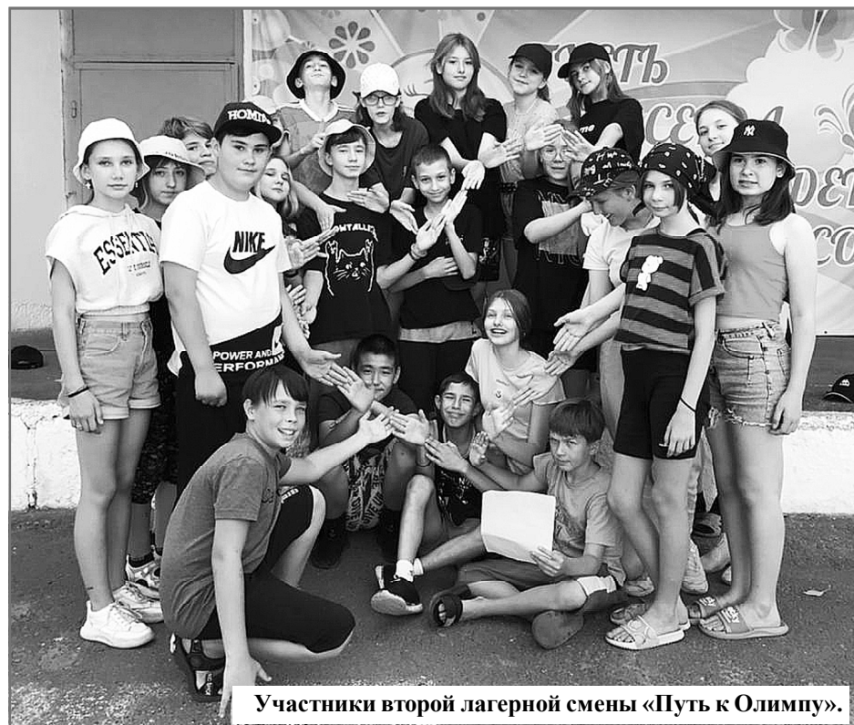
Участники второй лагерной смены «Путь к Олимпу».