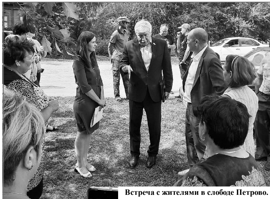
Встреча с жителями в слободке Петрово.