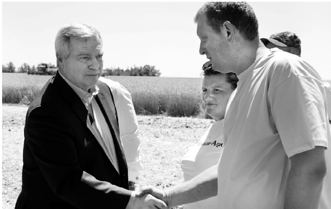
Донские сельчане в этом году показывают отличный результат по сбору урожая

Всего аграриям области предстоит убрать более 3 млн 350 тысяч гектаров зерновых и зернобобовых. Прогнозируемый урожай – более 13 млн тонн ранних зерновых культур. Как рассказал губернатору гендиректор «Кагальник-Агро» Роман Журба, средняя урожайность на их полях составила 65,6 центнера с гектара озимой пшеницы и 53,3 центнера с гектара зерновых и зернобобо-