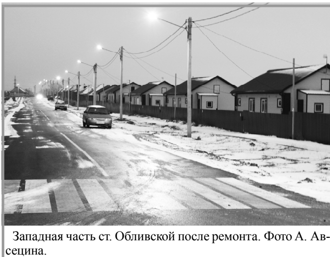
Западная часть ст. Обливской после ремонта.