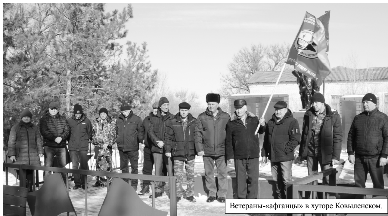
Ветераны-«афганцы» в хуторе Ковыленском.