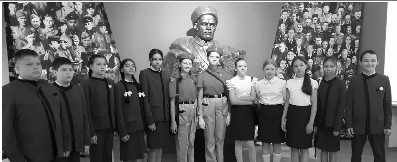
■ В национальном музее Республики Башкортостан.