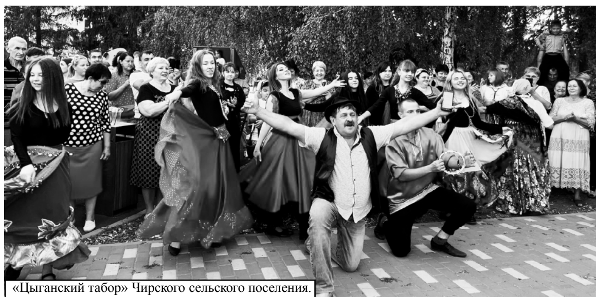
«Цыганский табор» Чирского сельского поселения.

Информация и фото предоставлены отделом культуры администрации Советского района.