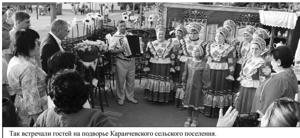
Так встречали гостей на подворье Караичевского сельского поселения.

курсы, работали аттракционы, батуты, электромобили.