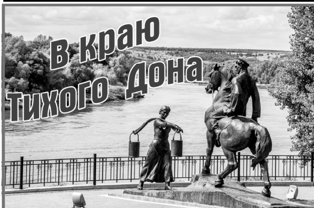
«В краю Тихого Дона» - проект газеты «Авангард», который будет направлен на сохранение и развитие казачьей культуры и традиций. В современном обществе интерес к казачеству – уникальному явлению отечественной истории и современности, огромен. Казачество во все времена считалось самым патриотичным слоем общества, жизнь его удивительна и уникальна. Страницы проекта расскажут о традициях и обычаях донского казачества, передающихся от поколения к поколению.