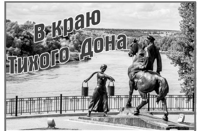
«В краю Тихого Дона» - проект газеты «Авангард», который будет направлен на сохранение и развитие казачьей культуры и традиций.

А.П.Скорик. Личность М. И. Платова в трактовках исторического процесса // Краеведческие записки. Вып. 6. 250 лет со дня рождения М.И.Платова. Новочеркасск, 2003. С. 15.