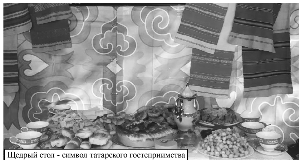
Щедрый стол - символ татарского гостеприимства