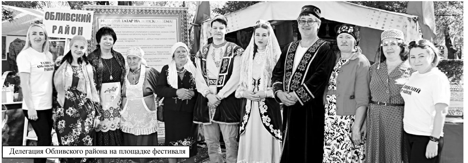
Делегация Обливского района на площадке фестиваля