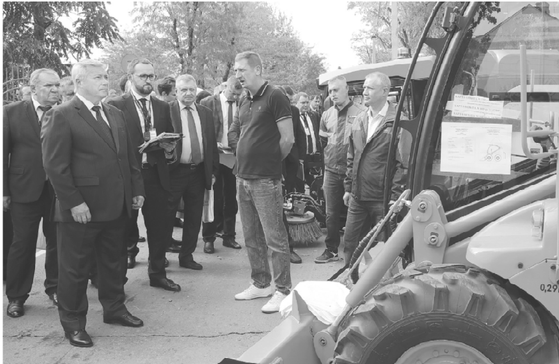
Семинар по благоустройству – площадка, где муниципалитеты могут обменяться опытом и познакомиться с новинками техники и технологий в этой сфере

На Дону накоплен достаточный опыт озеленения при благоустройстве территорий: с 2017 года более чем на 800 объектах