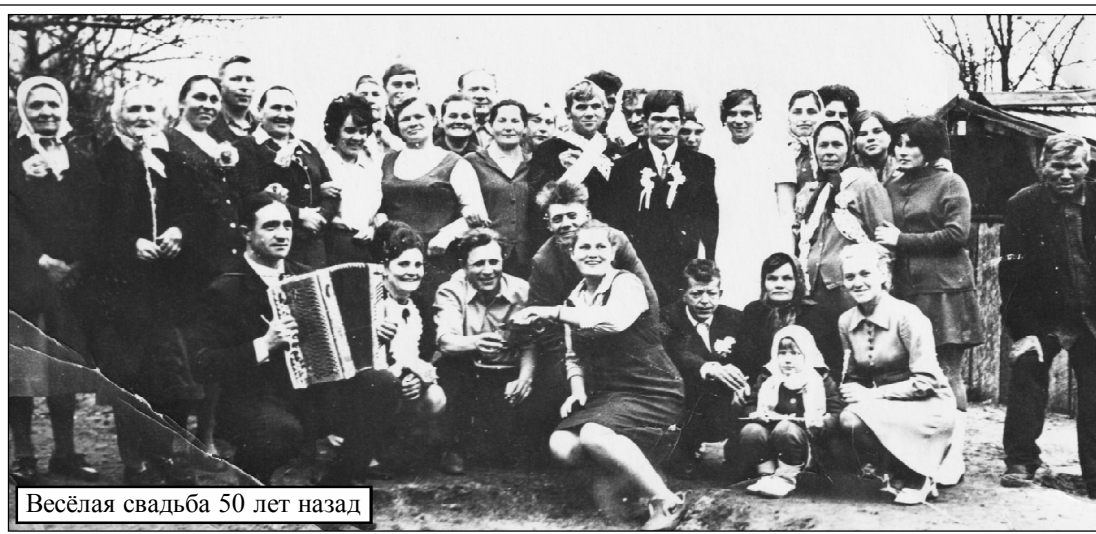
Весёлая свадьба 50 лет назад