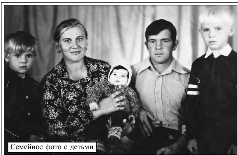
Семейное фото с детьми

А. АВСЕЦИН.