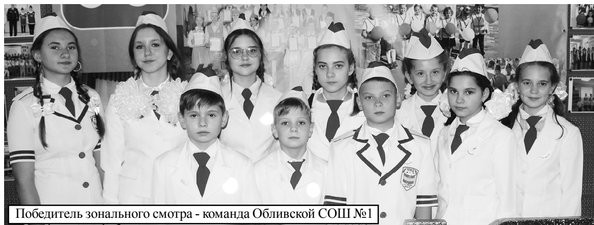
Победитель зонального смотра - команда Обливской СОШ №1