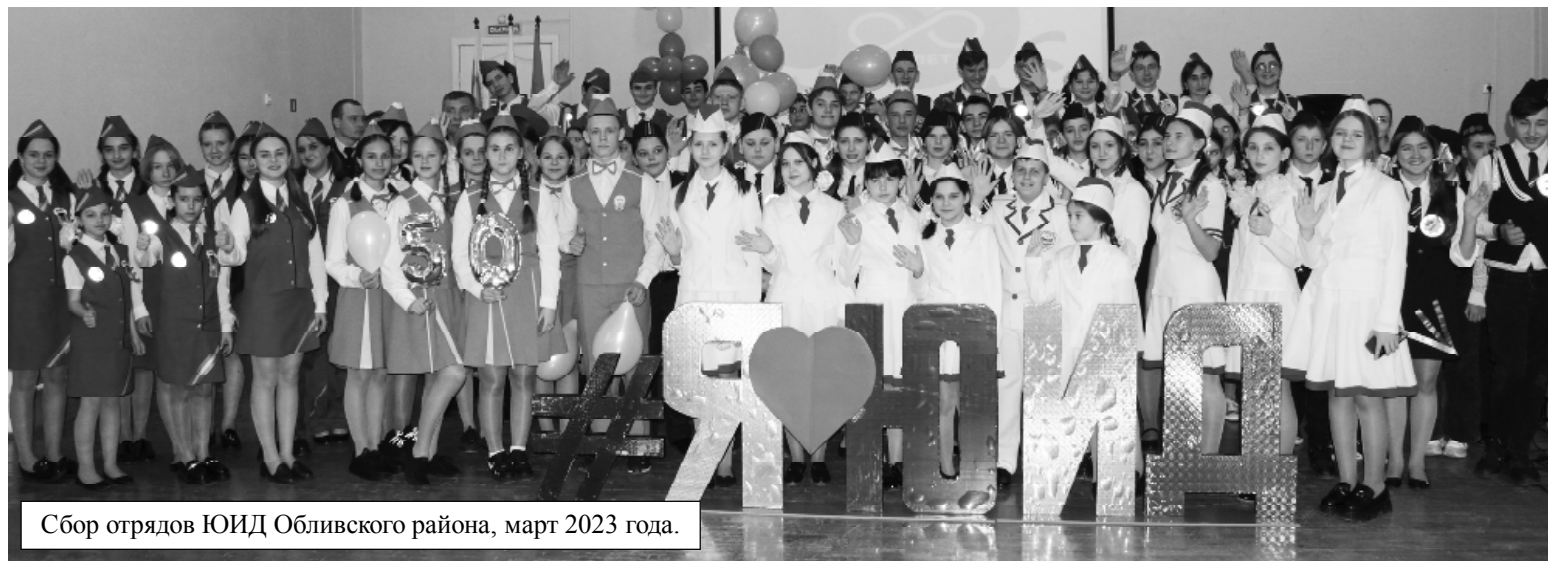
Сбор отрядов ЮИД Облиского района, март 2023 года.