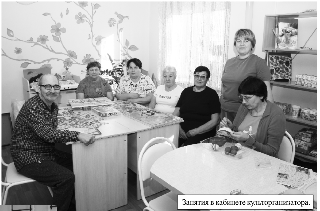
Занятия в кабинете культурного организатора.

- Судя по отзывам, для получателей услуг большое значение имеют мероприятия, которые