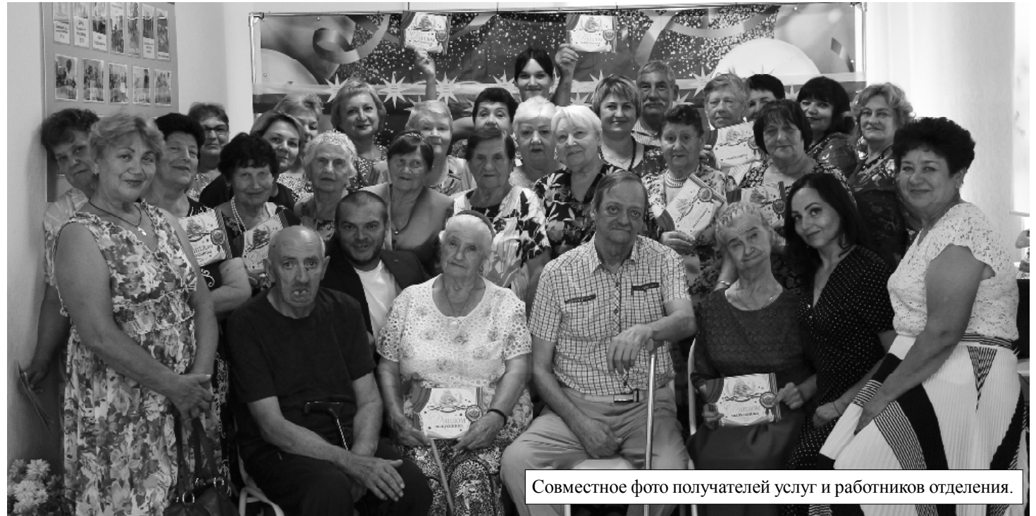
Совместное фото получателей услуг и работников отделения.

- С целью получения информации о результатах работы отделения в целом, поэтапно проводилось тестирование физического и психологического состояния получателей. Мониторинг эффективности применения программ реабилитации выявил положительный эффект. В процессе совместной работы всех специалистов заметен последовательный перенос приобретенных получателями физических, коммуникативных и психологических на-