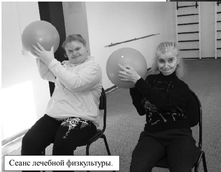
Сеанс лечебной физкультуры.

проводятся в дополнение к медицинской реабилитации, общение друг с другом и с работниками отделения.