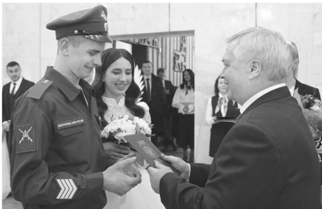
Каждая новая семья – вклад в будущее региона, уверен донской глава

Исторически так сложилось, что на Дону чтят семейные традиции и почитают многодетность.