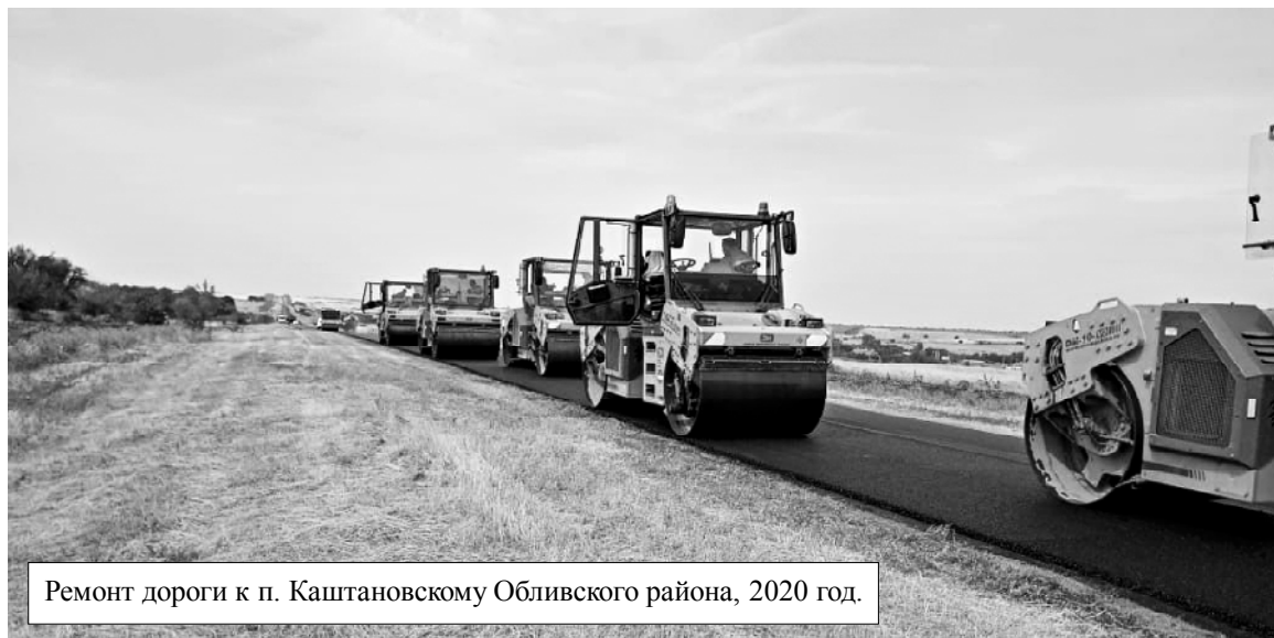
Ремонт дороги к п. Каштановскому Облиевского района, 2020 год.

В прошлом году в Ростовской области стартовала «трехлетка