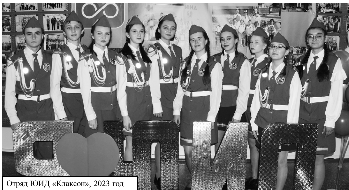
Отряд ЮИД «Клаксон», 2023 год