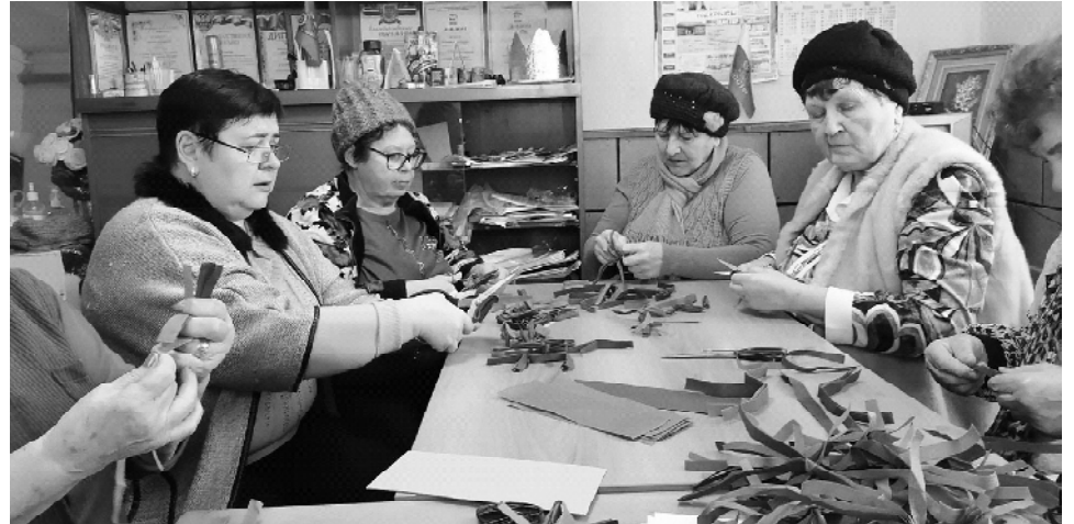
Участницы клуба «Вдохновение» (Чистяковский ЦСДК) делают заготовки для будущей маскировочной сети

Участники группы регулярно отправляют в зону СВО продукты, одежду, медикаменты для госпиталей, свечи, печки, суповые наборы, теплые вещи и так