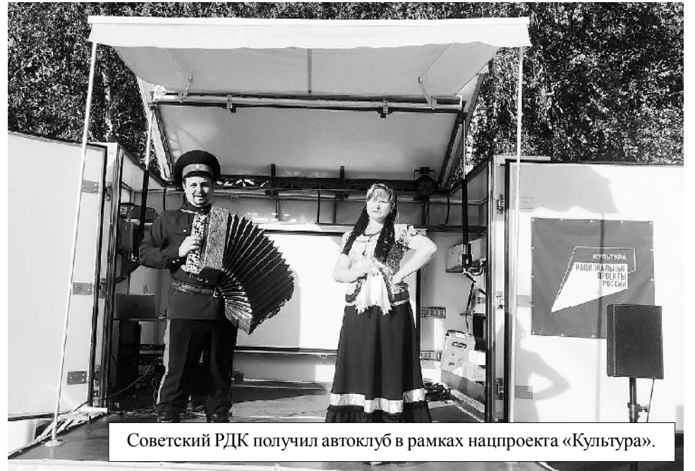
Советский РДК получил автоклуб в рамках нацпроекта «Культура».

Технически будут оснащены 5 музеев (4 государственных и 1 муниципальный музей в г. Донецке), 20 детских школ искусств, завершена работа по техническому оснащению 2 государственных театров. 41 лучший сельский работник и 27 лучших сельских