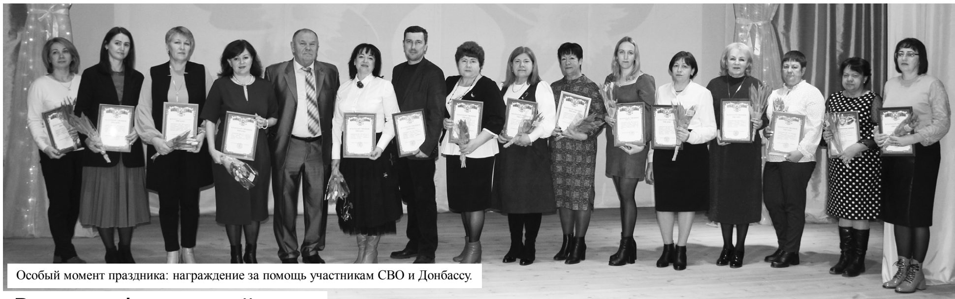
Особый момент праздника: награждение за помощь участникам СВО и Донбассу.