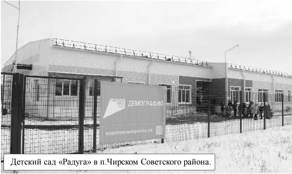
Детский сад «Радуга» в п.Чирском Советского района.