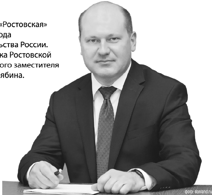
Александр Скрябин считает, что ОЭЗ «Ростовская» может стать базой для множества уникальных предприятий

Особая экономическая зона дает возможности для создания десятков предприятий. Среди бу-