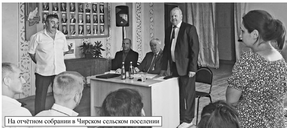
На отчётном собрании в Чирском сельском поселении