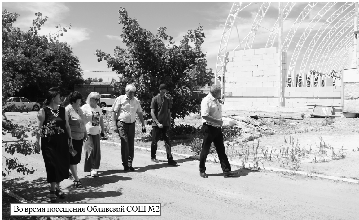
Во время посещения Обливской СОШ №2