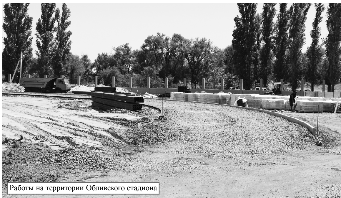
Работы на территории Обливского стадиона

Очередной рабочий визит в Обливский район сделал заместитель председателя Законодательного Собрания Ростовской области – председатель комитета по аграрной политике, природопользованию, земельным отношениям и делам казачества В.Н.Василенко . Он осмотрел объекты, на которых идет капитальный ремонт, ознакомился с ходом уборки в одном из хозяйств, встретился с активом района и провел депутатский прием граждан.