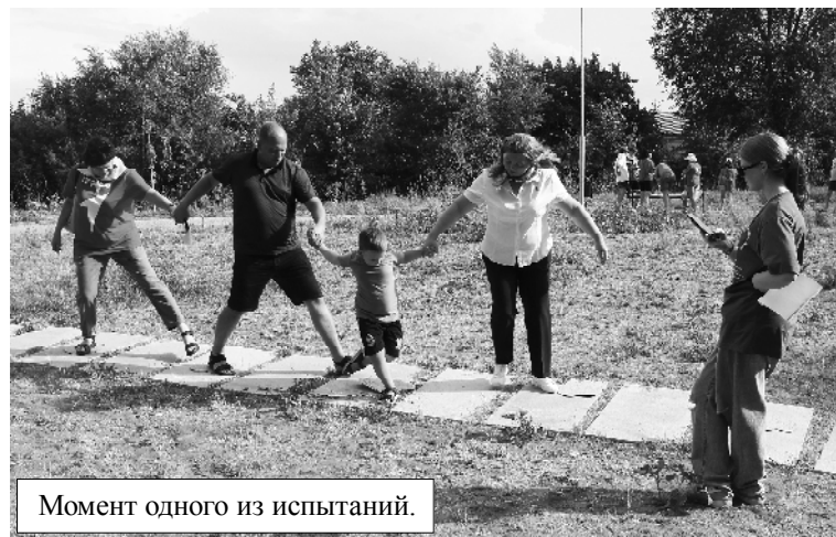
Момент одного из испытаний.

Активные семьи района приняли участие в юннатской экспедиции – тематическом квесте. Для побравшихся были подготовлены 10 станций, где участники смогли познакомиться с природой родного края. Ребята с родителями и наставниками наблюдали за птицами, следили за природными явлениями, изучали разные виды костров, проходили испытан-