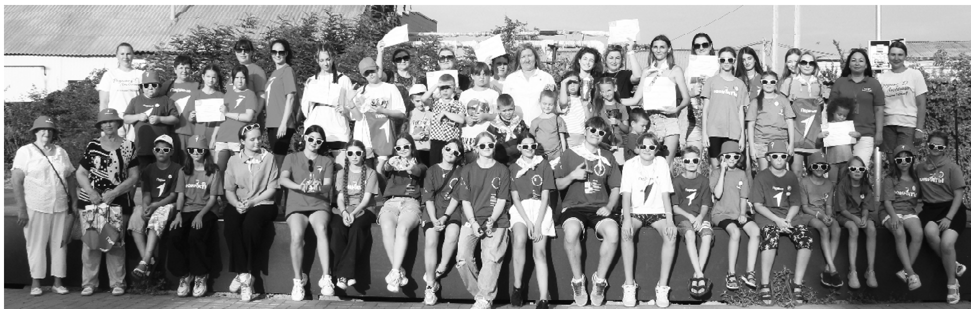
Общее фото участников форума.