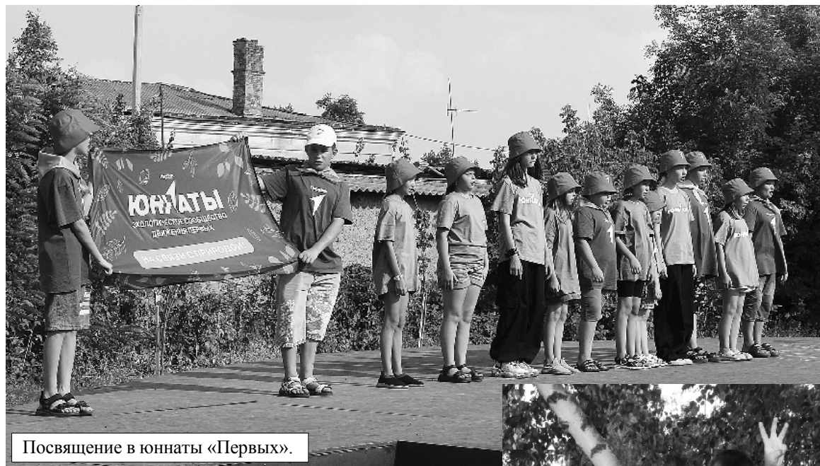
Посвящение в юннаты «Первых».

Большой Всероссийский форум семейных юннатских экспедиций состоялся в Обливском районе. В парке Добра собрались активные семьи, чтобы проявить себя и просто хорошо провести время в кругу родных-любимых. Юннатские экспедиции, которые до конца лета проводятся в муниципальных образованиях Ростовской области, способствуют формированию экологической культуры, приобретению новых знаний и навыков для дальнейшего изучения окружающего мира.