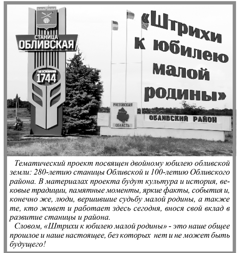
Тематический проект посвящен двойному юбилею обливской земли: 280-летию станции Обливской и 100-летию Обливского района. В материалах проекта будут культура и история, вековые традиции, памятные моменты, яркие факты, события и, конечно же, люди, вершившие судьбу малой родины, а также те, кто живет и работает здесь сегодня, внося свой вклад в развитие станции и района. Словом, «Штрихи к юбилею малой родины» - это наше общее прошлое и наше настоящее, без которых нет и не может быть будущего!

коллективизации, раскулачивания, войне и немецкой оккупации. Летом 1942 года в хутор пришли немцы, но немногие поселились здесь, так как жители схитрили, сказав, что в их домах лежат больные тифом. А когда через пять месяцев началось отступление немцев, Кзыл-Аул заняли бендеровцы. Желая устроить расправу над жителями, они заходили с автоматами в дома и сгоняли людей к железнодорожным путям, на которых стоял бронепоезд. Из его орудий захватчики планировали расстрелять жителей. К счастью, помогли партизаны, занявшие соседний хутор Ковыленский: их разведка сообщила о готовившейся акции, и советские самолеты разбомбили вражеский бронепоезд. В годы войны жители Кзыл-Аула спасали беженцев из Сталинграда, укрывая их в своих домах и делясь всем, что имели сами, а после победы вместе со всем советским народом, станичниками и жителями района восстанавливали разрушенное войной, налаживали мирную жизнь. Особенно много строились в 70-е, 80-е годы.