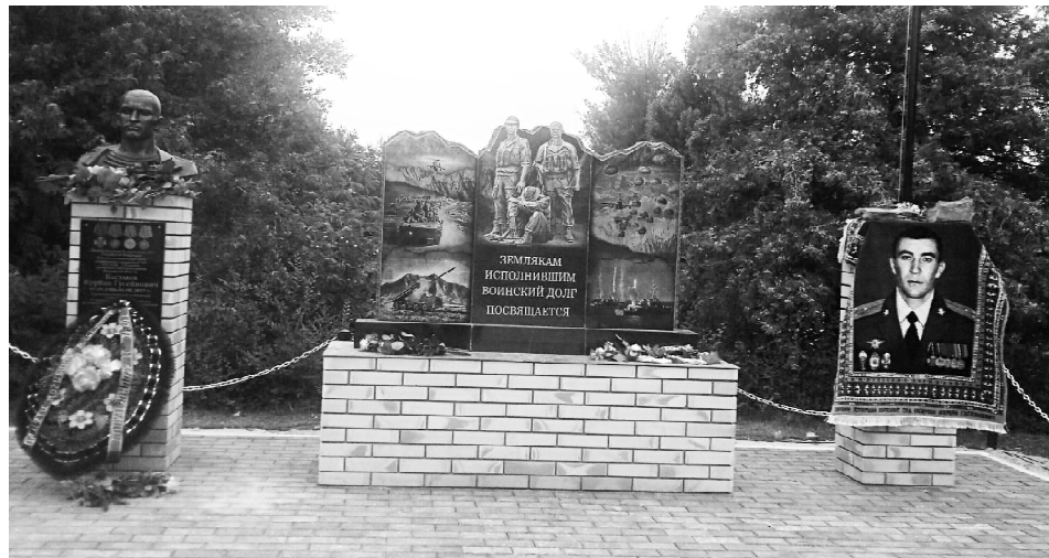
■ Новый мемориал в ст. Советской.