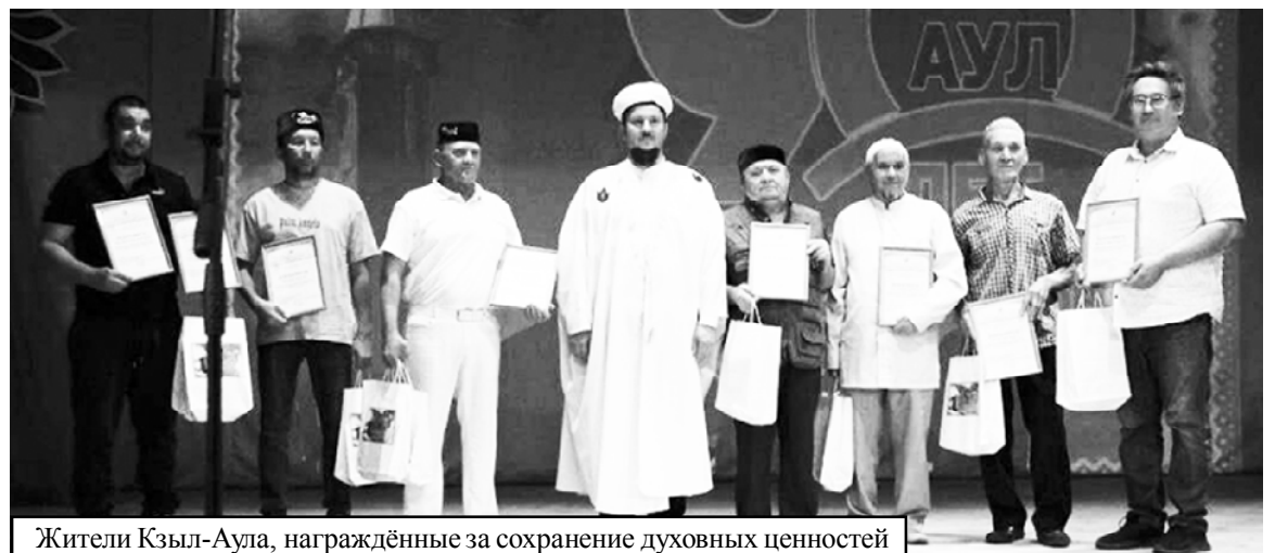
Жители Кзыл-Аула, награждённые за сохранение духовных ценностей