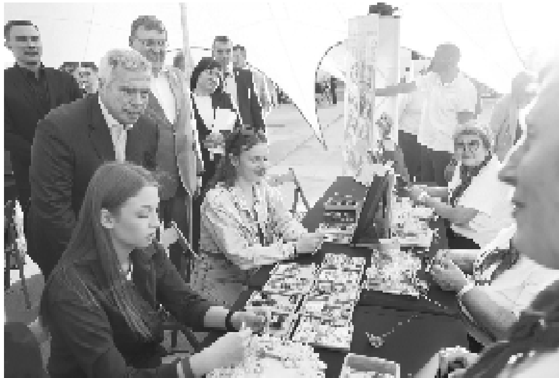
Участники форума «Добрых дел» обсуждают вопросы социальной ответственности бизнеса.

Форум «Добрых дел» прошел в доиндустриальной эпохе в Ростове-на-Дону. В мероприятии приняли участие представители различных организаций.