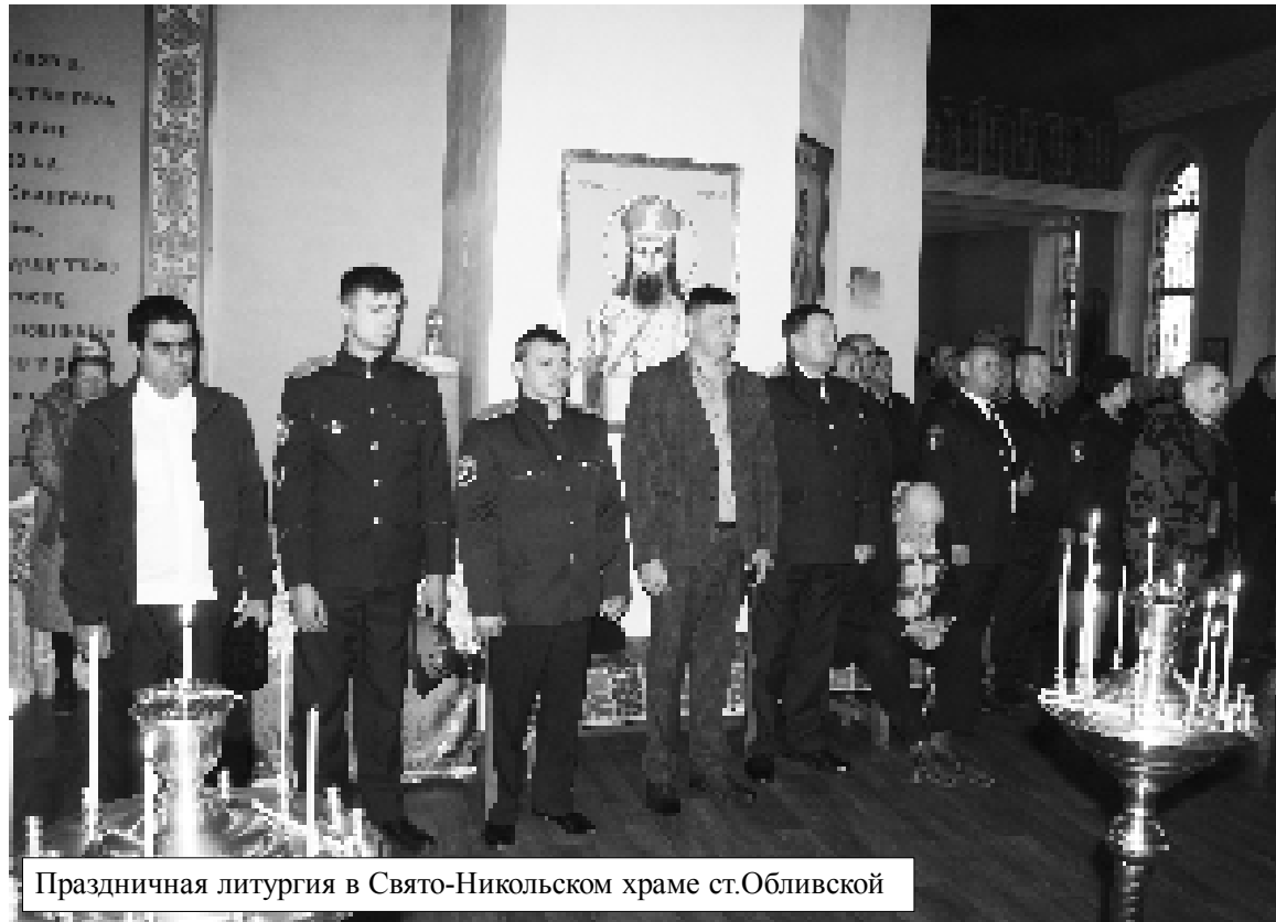
Праздничная литургия в Свято-Никольском храме ст.Обливской

В станице Обливской, в Свято-Никольском храме, 14 октября прошла праздничная Божественная литургия, посвященная православному празднику – Покрова Пресвятой Богородицы. В ней приняли участие казаки юртового казачьего общества «Обливский юрт» Окружного казачьего общества Верхне-Донского округа войскового казачьего общества