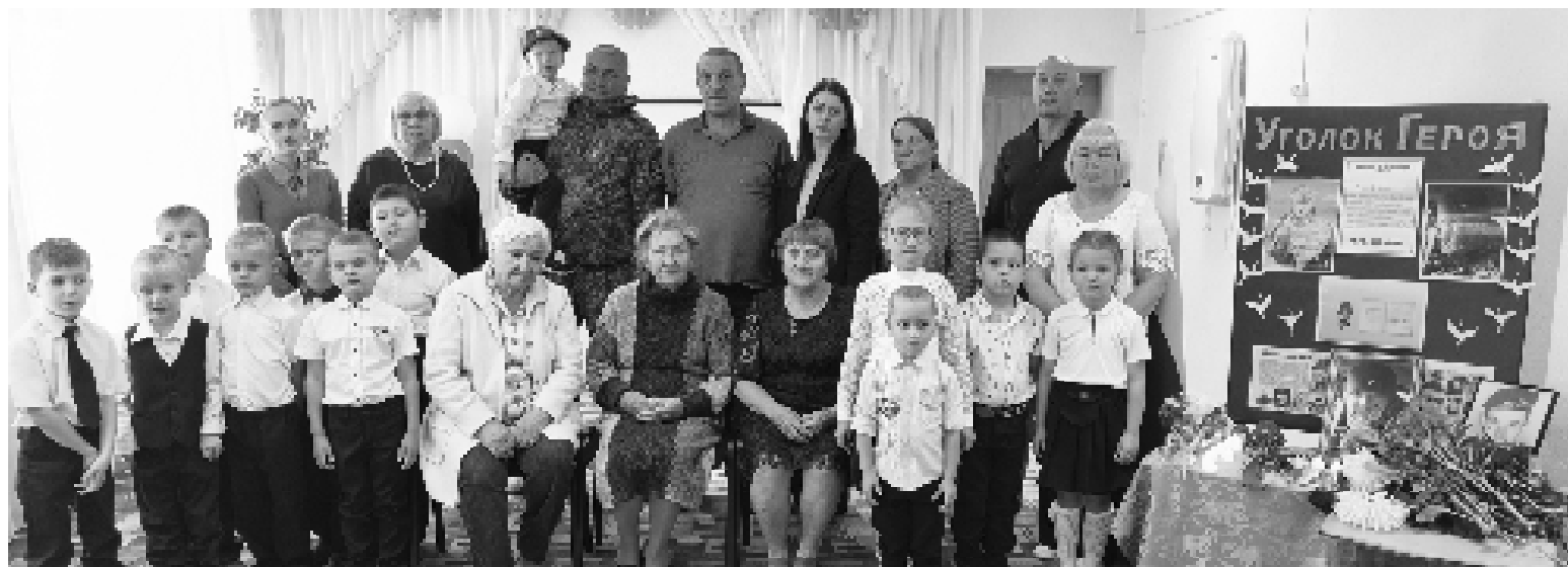
Встреча в «Топольке»

По информации МБДОУ «Детский сад «Топольке»».