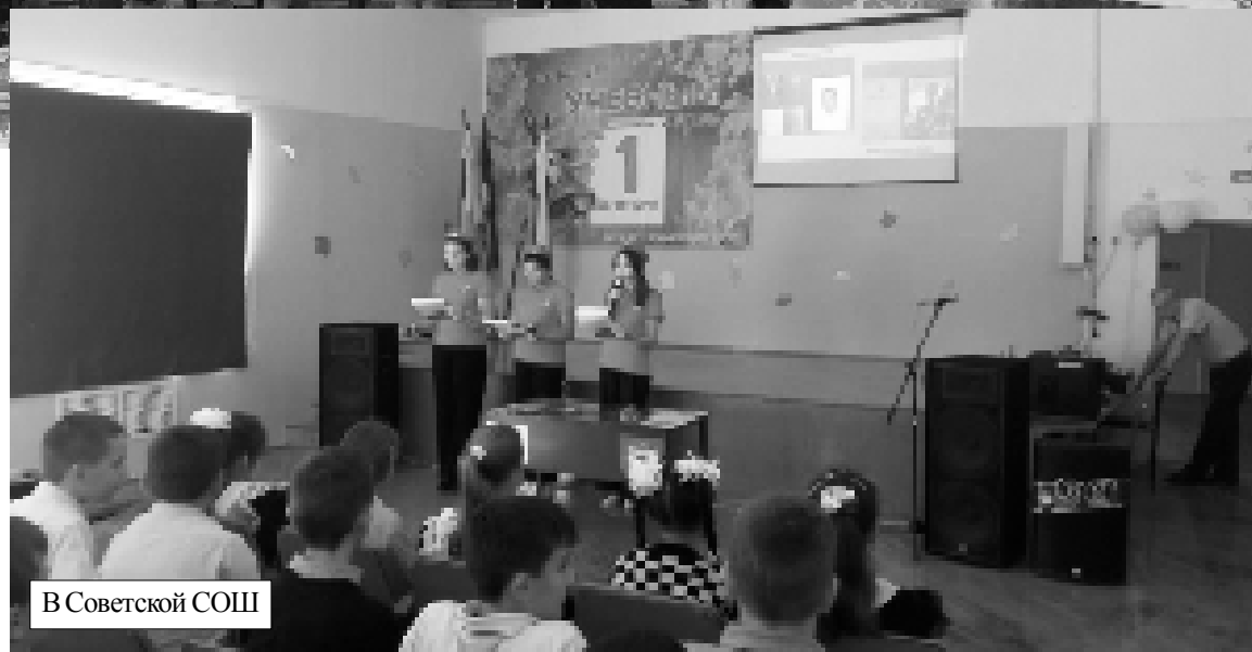
В Советской СОШ