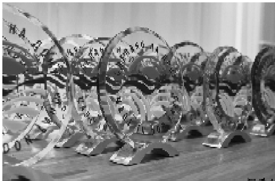
Эти награды вручили участникам программы «Бизнес-мамы Бизнес».

Удмуртские производители получили сертификат на участие в системе «Бизнес-мамы Бизнес» в рамках программы «Мамы-предприниматели». Это позволит им расширить географию продаж и привлечь новых клиентов.