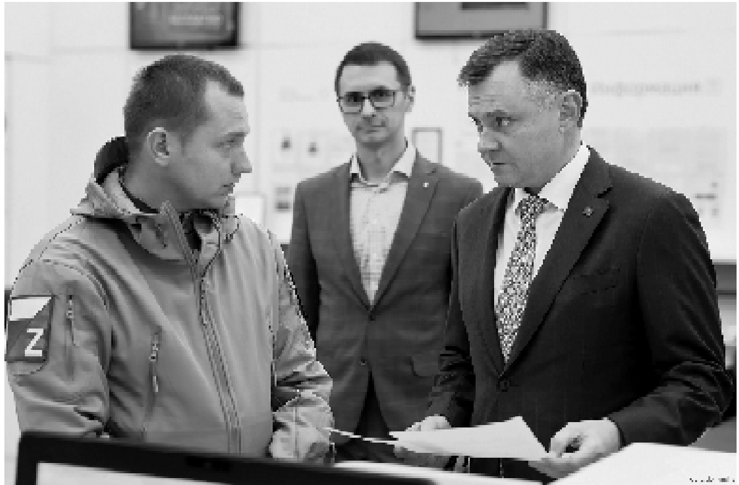
Губернатор Василий Голубев (справа) с представителями органов власти.

В Ростовской области реализуется программа помощи фрегату. Она направлена на обеспечение нужд флота и развитие судостроительной отрасли.