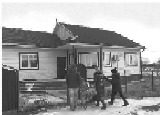
Социальную выплату можно направить на:

Необходимо проработать не менее 5 лет со дня получения социальной выплаты в организациях одной сферы деятельности на сельской территории, в которой было построено/приобретено жилье.