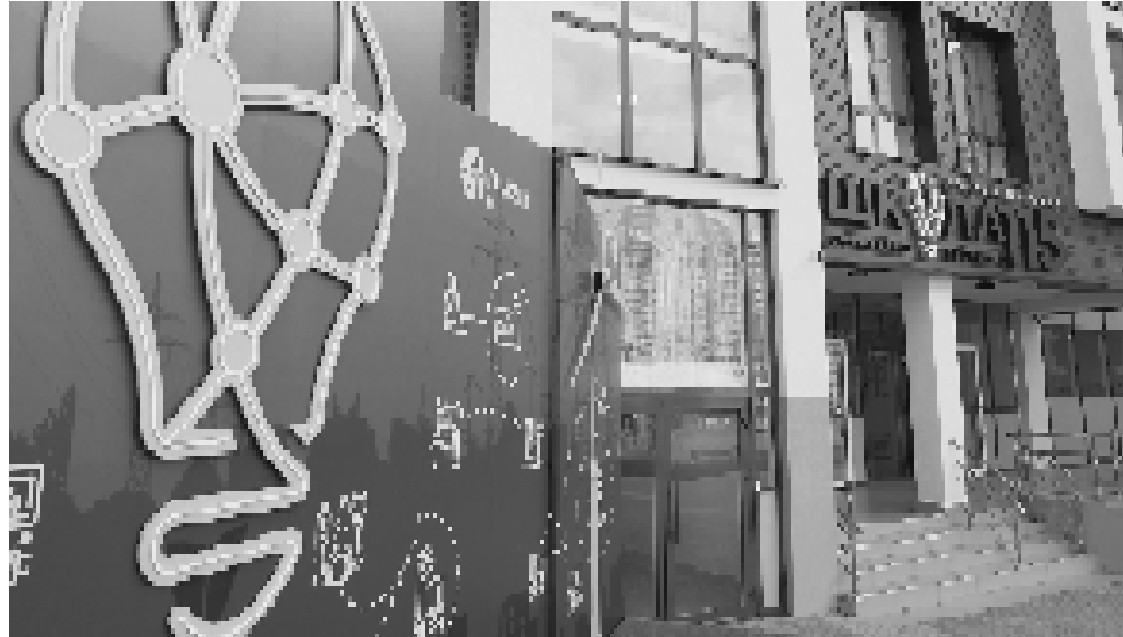
Фабрика «Южсталь» в городе Шахты.

Глава региона и продолжит работу по развитию экономики региона. В частности, будет реализована программа модернизации промышленности.