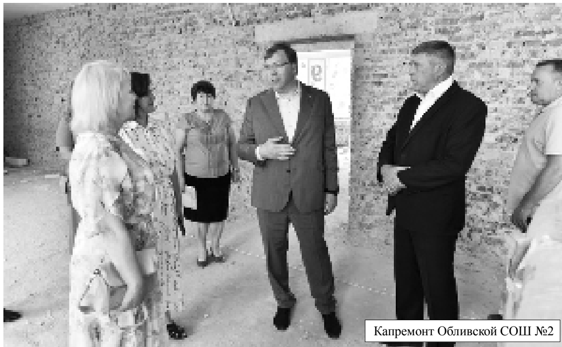
Капремонт Обливской СОШ №2

Информация предоставлена Обливским и Советским местными отделениями партии «Единая Россия».