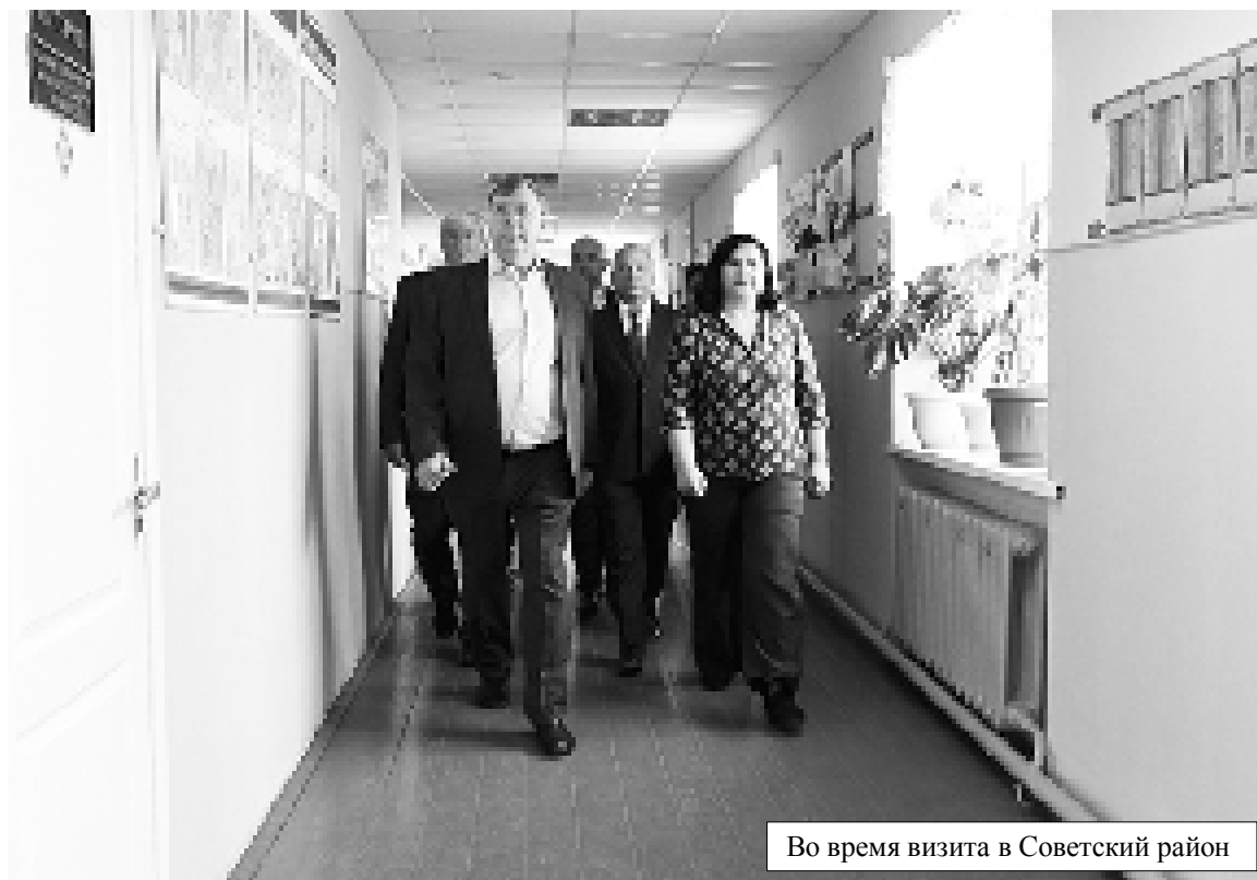
Во время визита в Советский район