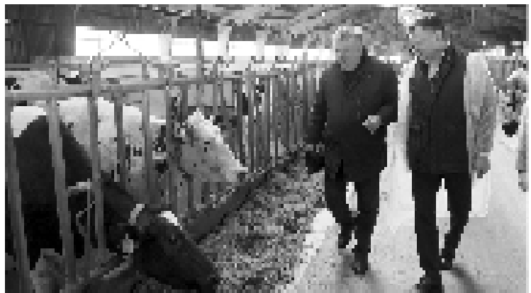
Визит главы региона Юрия Слюсаря в районы области