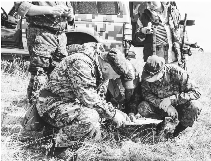
■ Участники поискового объединения ведут работу.

С 18 по 29 сентября в Обливском районе прошла Межрегиональная «Вахта памяти-2019». Ее провели общественное движение «Поискское движение концерна «Росэнергоатом» и Ростовское Региональное отделение ООД «Поискское движение России». В экспедиции приняли участие поисковики из отрядов «Аверс» (Балаковская АЭС), «Калина» (Калининская АЭС), «Высота» (Курская АЭС), «Сосновый бор» (Ленинградская АЭС), «Пересвет» (Нововоронежская АЭС), «Родник» (Ростовская АЭС), «Обелиск» (Смоленская АЭС), а также из ростовского отряда «Военное время», отрядов «Сармат» (Чернышковский район Волгоградской области), «Подвиг» (Курьоргазинский район Башкортостана), Сальского казачьего клуба «Русич» Ростовской