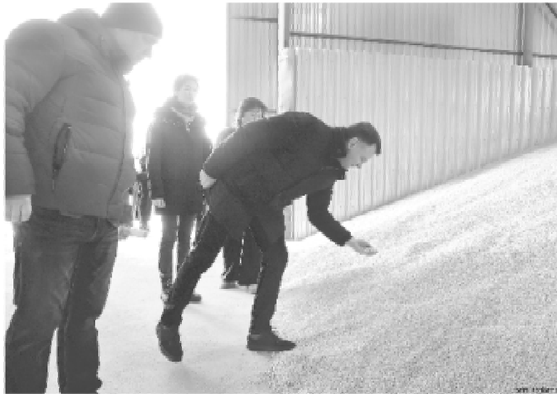
1 сорбента сельхозпродукции в регионе – один из вариантов драйвера развития агропродовольствия

Мы сохранили поддержку на уровне прошлого года – 8,1 млрд рублей – это уровень поддержки в среднем по региону. Задача-максимум – этот