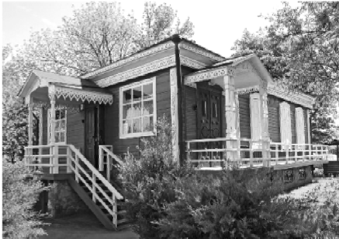
Например, в Ростовской области удалось реализовать целый ряд проектов XIX века, включая Музей истории донской казачьей культуры, реконструкция вильи

Жители области могут внести свой вклад в развитие культуры Дона, уверен губернатор Юрий Слюсарь, достаточно посетить музей в своем муниципалитете. Заметную поддержку музеям и театрам оказывает и молодежь – используя «Пушкинскую карту».