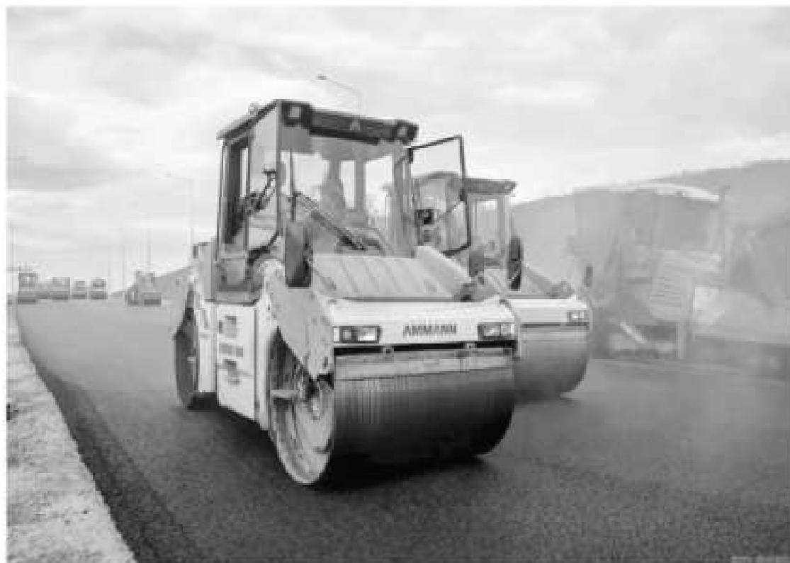
Дорожники Ростовской области приступают к ремонтным работам