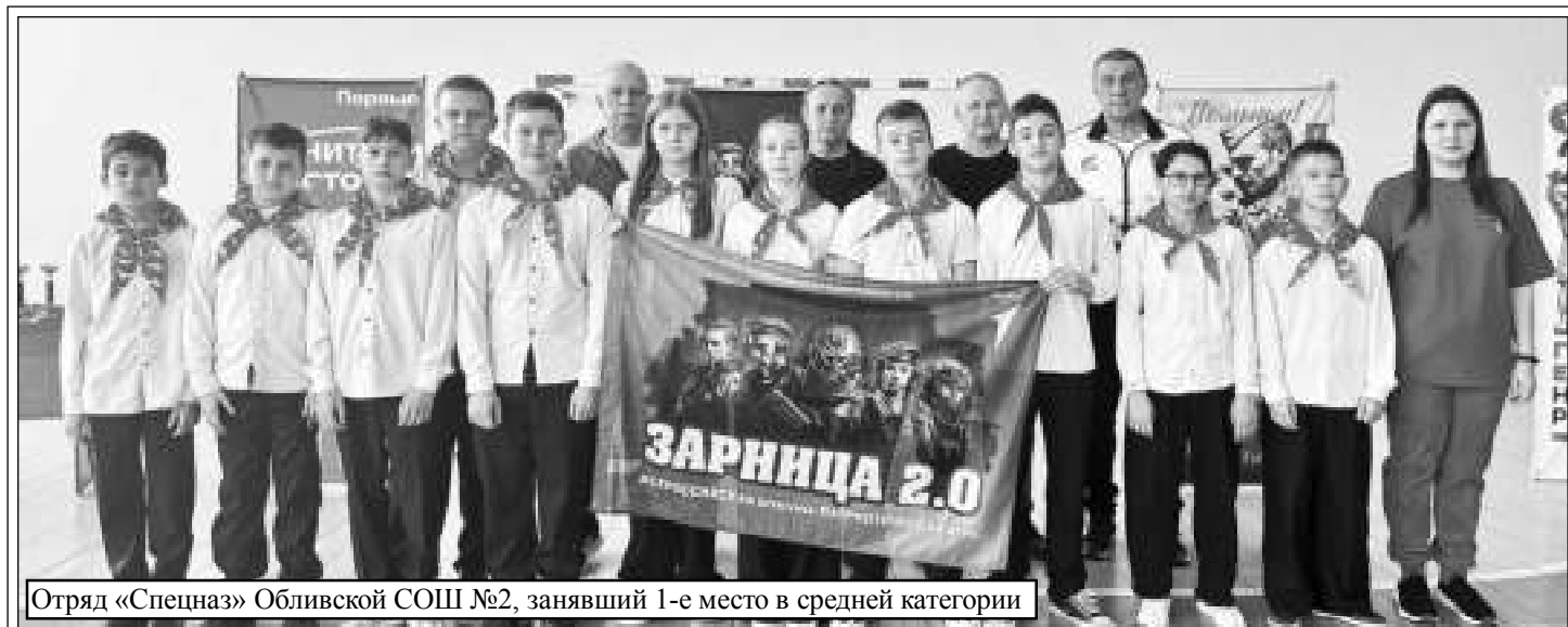
Отряд «Спецназ» Обливской СОШ №2, занявший 1-е место в средней категории