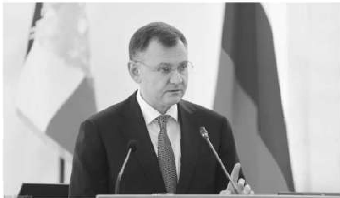
В Ростовской области реализуются проекты в различных сферах. Их главная задача – повысить комфорт жизни в районах

Глава региона сообщила, что Ростовская область участвует в реализации 43 региональных проектов в рамках 12 национальных. По итогам 2025 года на их реализацию было направлено более 39 млрд рублей. Кроме того, прошлый год стал годом масштабной