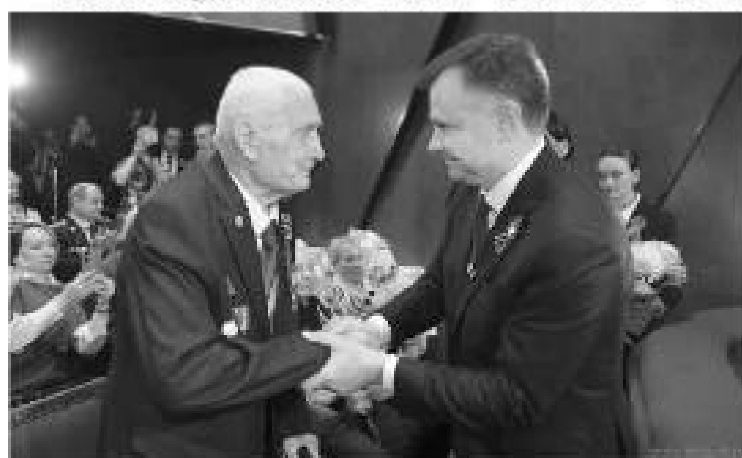
На торжественном собрании губернатор лично поздравил фронтовиков

Слова благодарности глава региона также адресовал пенсионерам, которые по крупицам восстанавливают имена неизвестных героев.