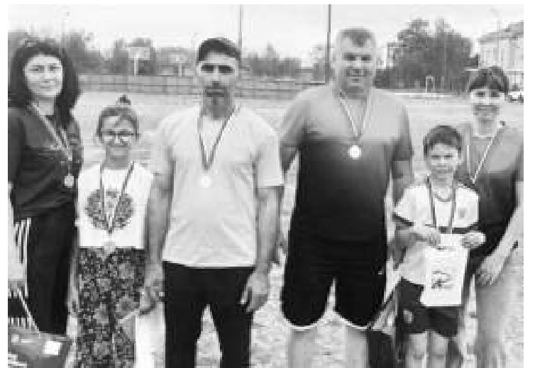
Информация и фото предоставлены администрацией Советского района.

Праздник спорта в Советском районе стал ярким событием, способствующим популяризации физической культуры и спорта среди населения, а также укреплению здоровья и позитивного настроения жителей.