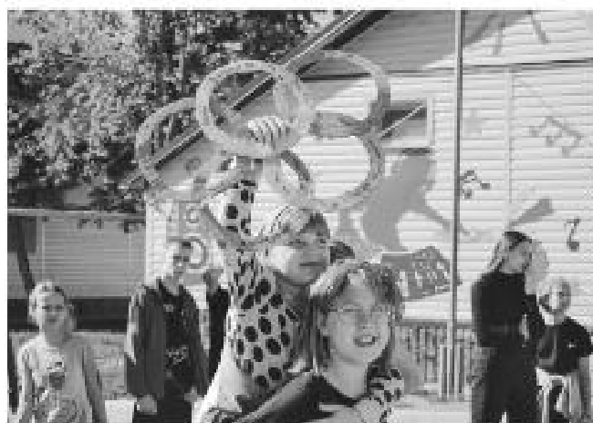
ФОТО: ИСТОРИЯ ОБРАЗОВАНИЯ РОСТОВСКОЙ ОБЛАСТИ

28 стационарных загородных лагерей и более 830 лагерей с дневным пребыванием – пришкольных – будут работать в Ростовской области.