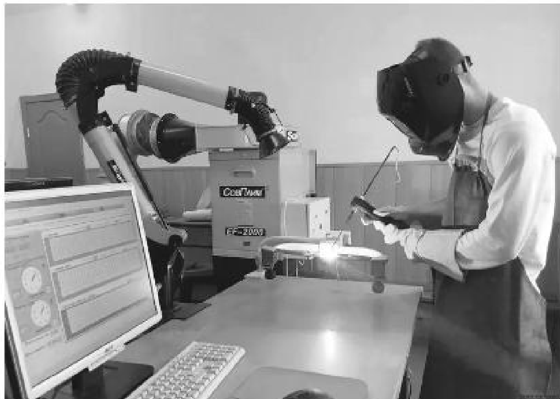
Подготовка инженерных и технических кадров – важный этап в становлении технологического лидерства страны

У нас их две. На базе опорного вуза – Донского государственного технического университета в сотрудничестве с «Рост-