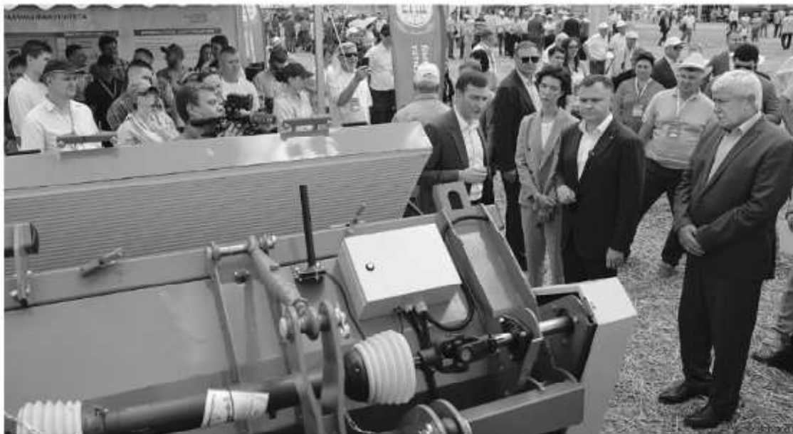
Ученые и машиностроители области представили новейшие образцы техники

Донские ученые представили 95 селекционных и 28 опытных образцов адаптированных культур.