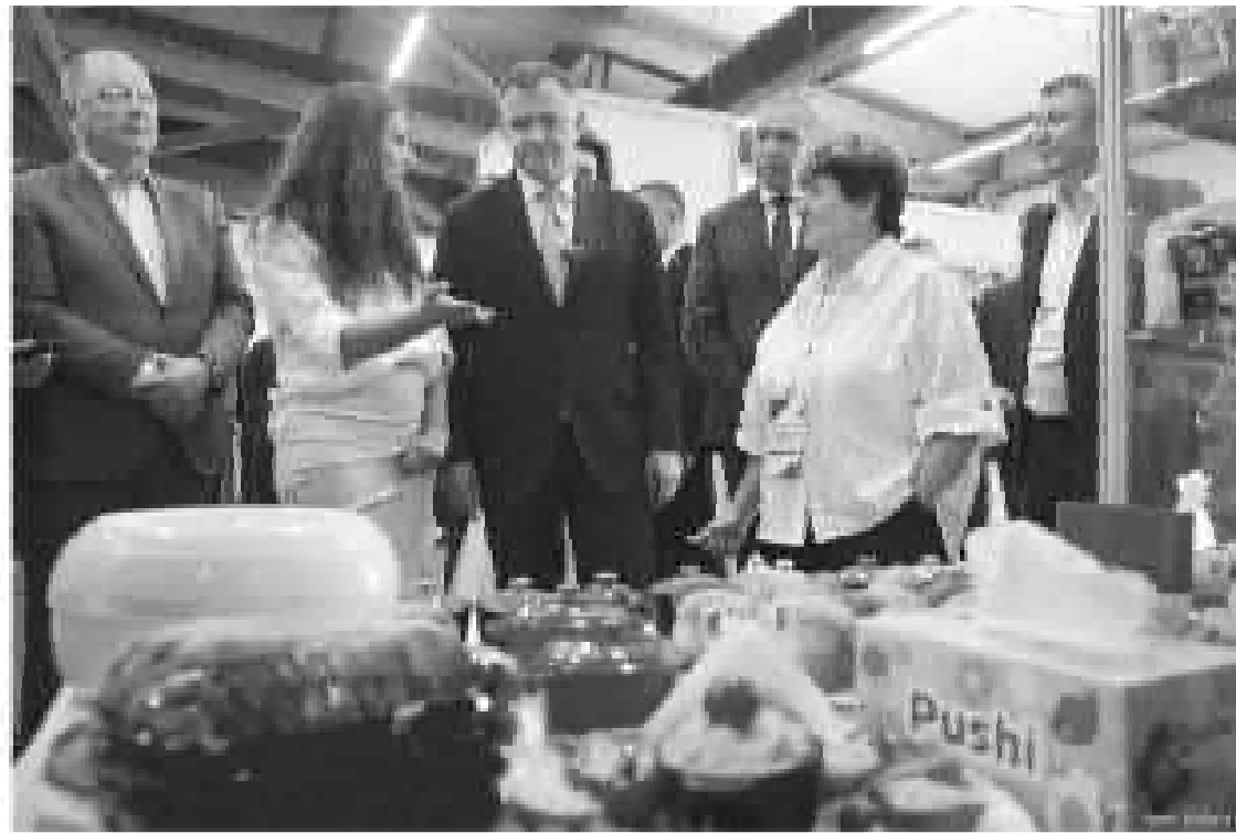
Донские товары подвезены в торговую экспозицию

Как отметил открывший сессию губернатор Ростовской