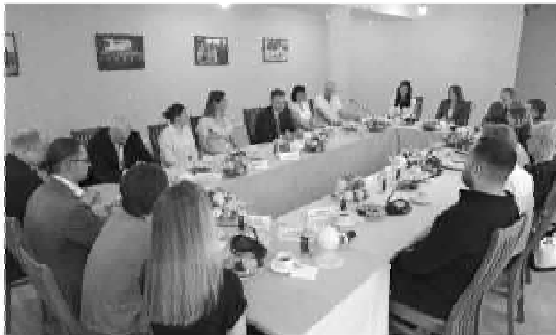
Также встретился с профессионалами помощи от области признать более официально россияне.