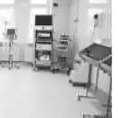
Для специалистов в работе медиков. Благодаря развитию областного здравоохранения оборудованием.

или губернатора, могут помочь и в этой сфере. Он поставил задачу областному правительству и медицинскому персоналу области сделать все возможное и даже больше, чтобы решить, обеспечить, улучшить, улучшить условия работы, чтобы врачи могли спокойно выполнять свою работу и помогать людям.